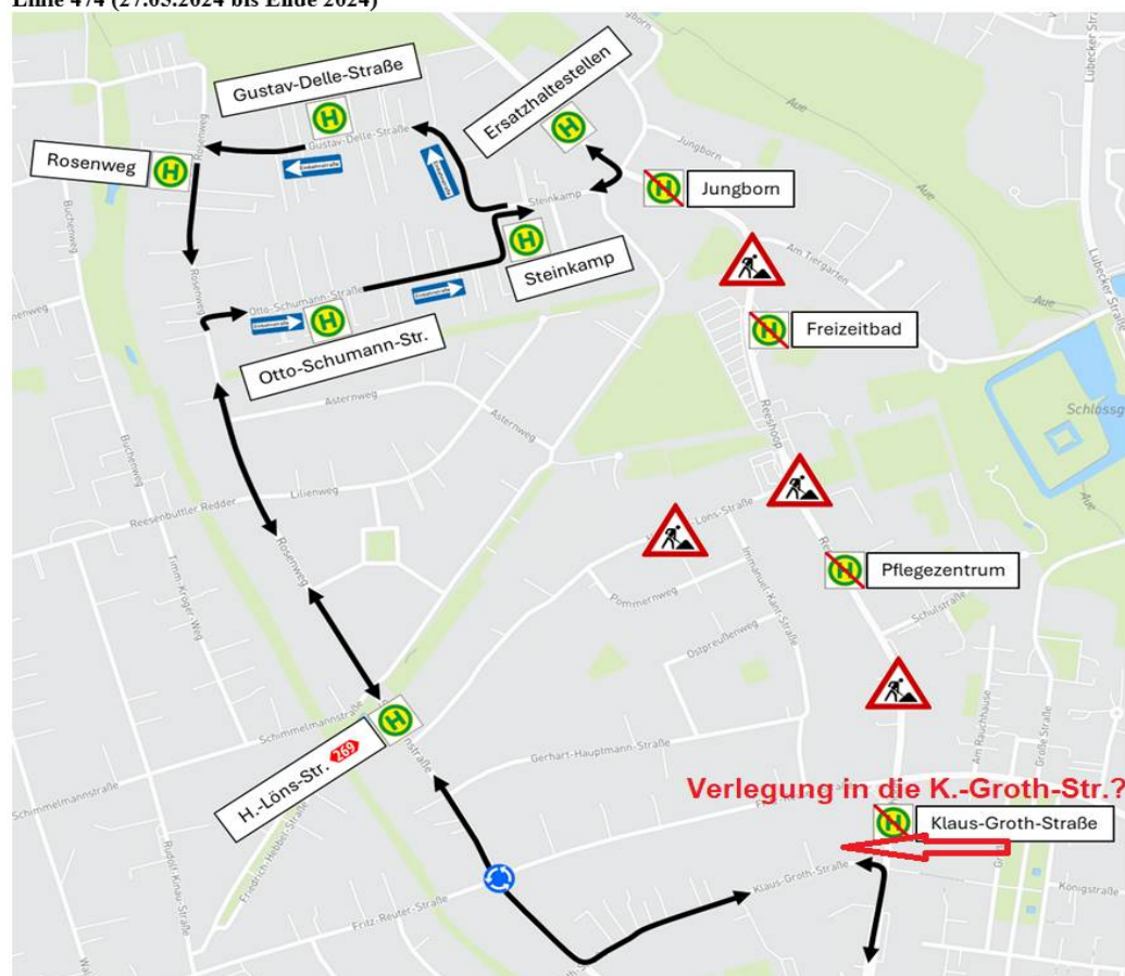
Linie 474 (27.05.2024 bis Ende 2024)

Angebunden ist somit wieder das Gebiet „Steinkamp“, die noch bestehenden Haltestellen wurden reaktiviert.