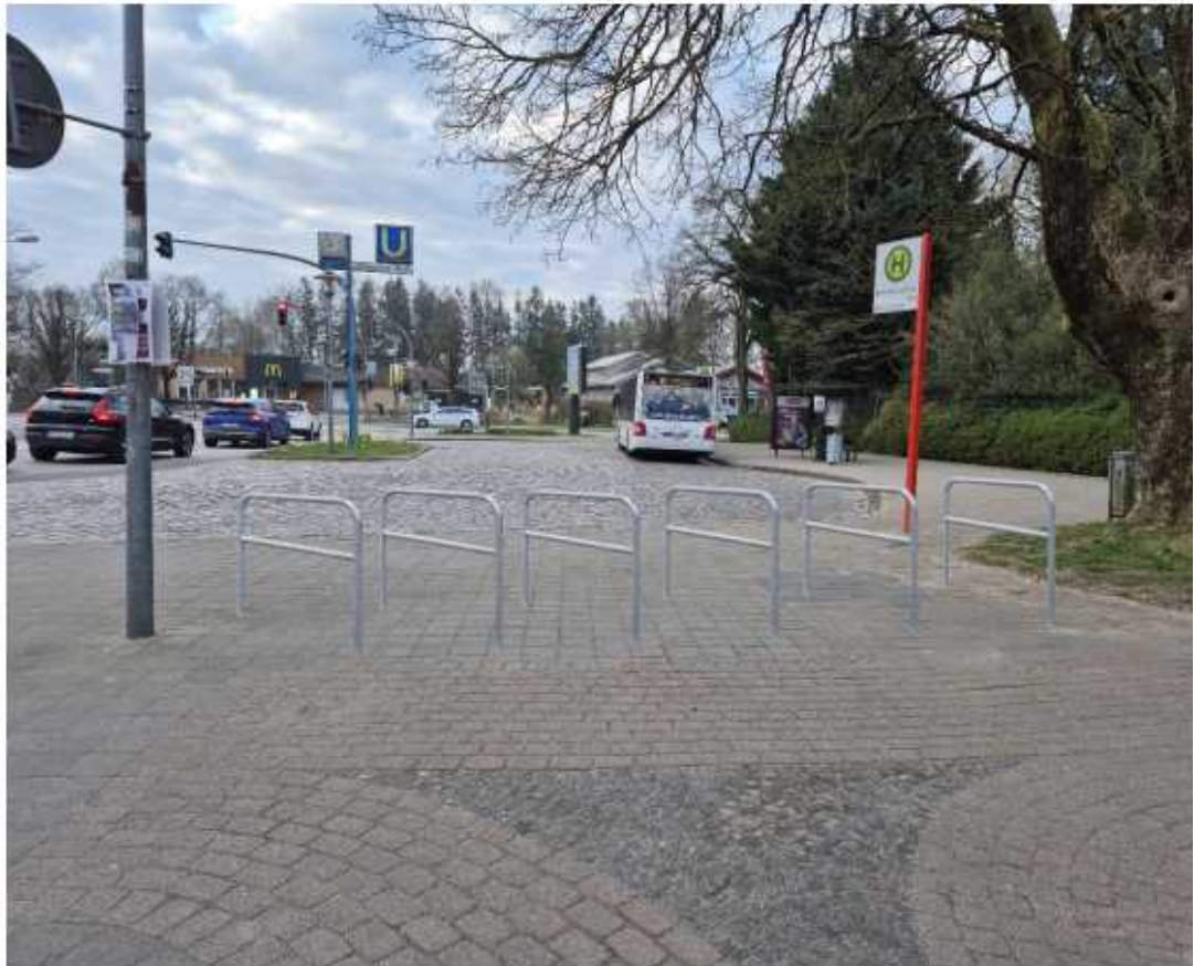
Visualisierung der sechs Anlehnbügel zwischen dem Baum und der Laterne.

Die weitere Prüfung des Standortes in Bezug auf Kapazitätserweiterungen der Fahrradstellplätze hat keine weiteren Potenziale ergeben. So sind Abstandsflächen zu gering, Flächen nicht im Besitz der Stadt oder würden Wegebeziehungen gestört.