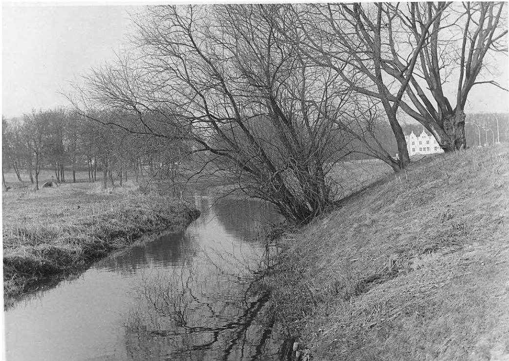
Blick auf Bauernbrücke und Schloss