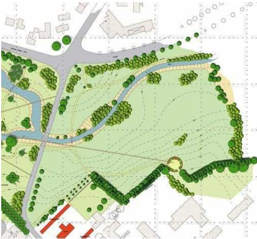
Gartenhistorisches Gutachten, Zielsetzung – Ausschnitt